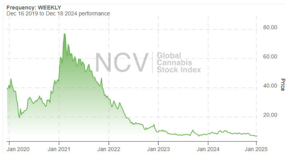
גרף 1- מדד המניות העולמי של חברות קנאביס 17

53. בנוסף, חשוב לציין כי מגמות אלה של עלייה במספר השחקנים ושינויים ברגולציה אינן ייחודיות לישראל. במדינות רבות בעולם חלים שינויי רגולציה בשנים האחרונות אשר נועדו להקל על מטופלים הצורכים קנאביס רפואי וכן מדינות אשר מאפשרות לגליזציה מלאה לשימוש פנאי של קנאביס. יחד עם שינויי הרגולציה, המגמות בתחום הקנאביס הרפואי בכל העולם מצביעות על ירידה בשווי חברות הקנאביס. כפי שניתן לראות מגרף 1 המציג את מדד חברות הקנאביס העולמי, מתחילת שנת 2021, חלה ירידה משמעותית בשווי חברות הקנאביס בעולם.